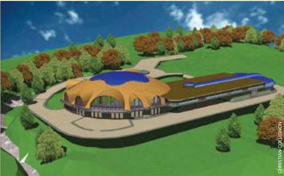
Vue en perspective du «centre thermoludique». La partie sphérique est destinée à abriter plusieurs installations thérapeutiques fonctionnant à l'eau, comme des bains tourbillons, couloirs de marche, hydromasseurs, etc.